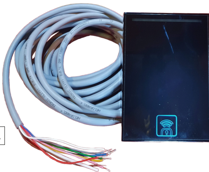
popis vývodů kabelu